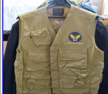
Corpetto Mod. C-1 Vest Made in USA